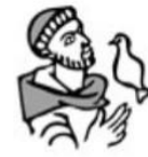
Parochie St. Franciscus van Assisië Boekelo-Buurse-Haaksbergen